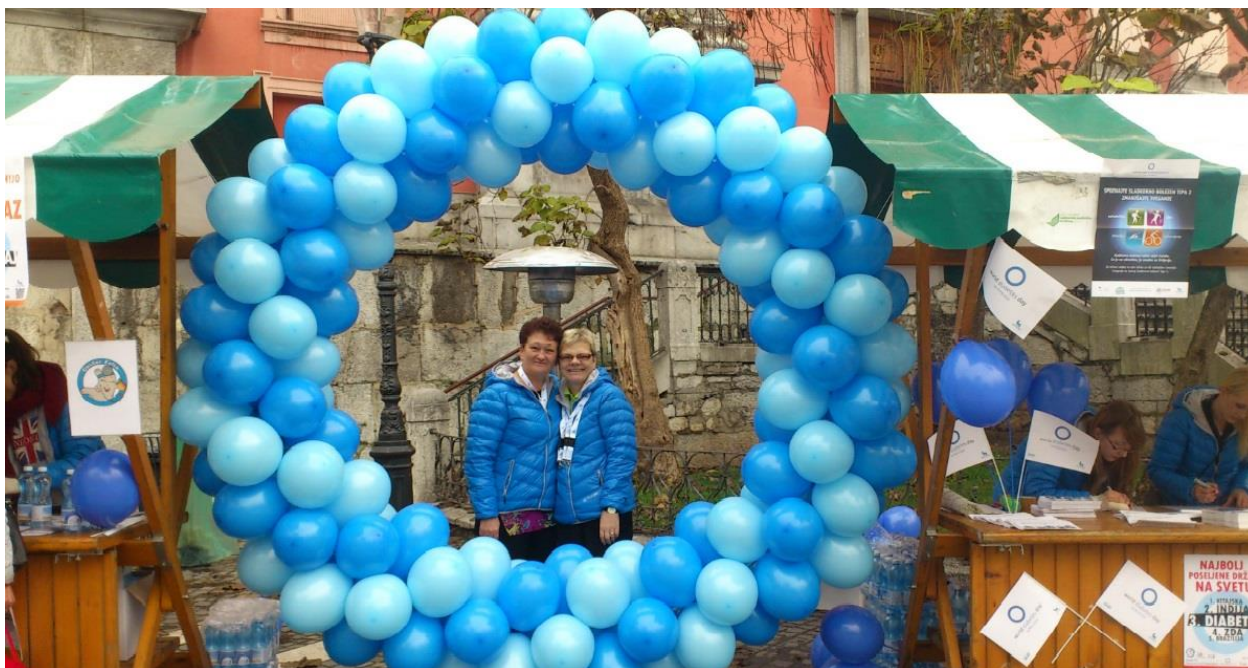
Foto natečaj na tekmovanju v znanju o sladkorni bolezni

Povezava do dogodka: https://www.facebook.com/events/852426304917268/